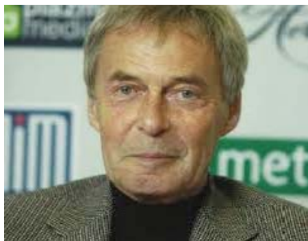
Rubik Ernő, a kocka feltalálója