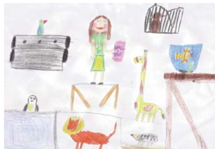
Pakodi Csenge 3.s