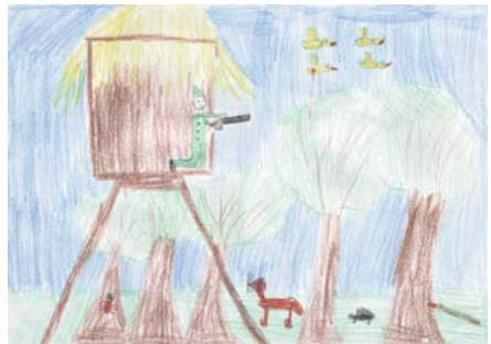
Kréusz Márton 3.s