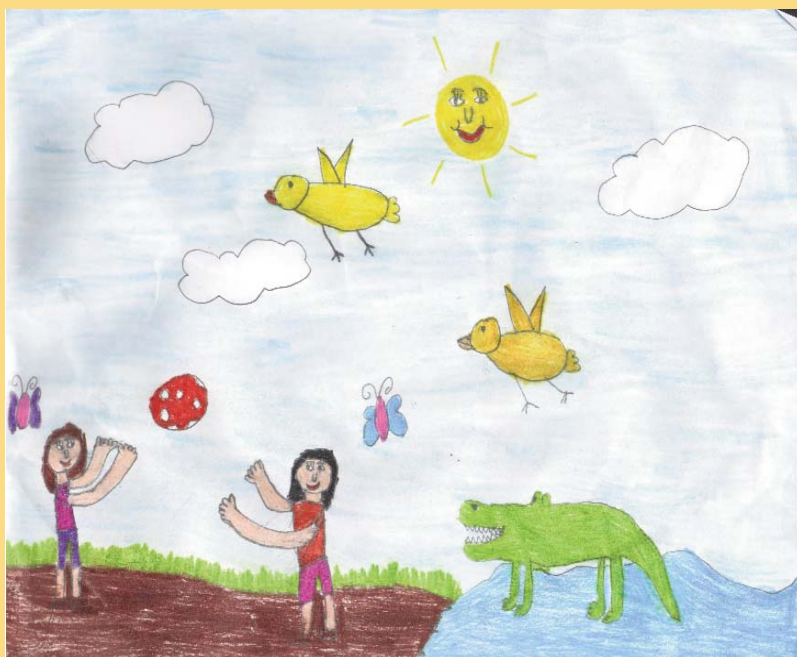
Botos Auróra 3.s